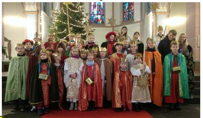
Sternsinger in der Marienkirche