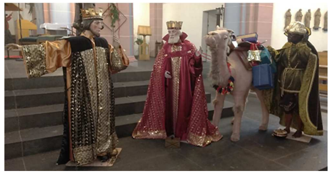
Die drei Sterndeuter („Heiligen Drei Könige“) unterwegs nach Bethlehem