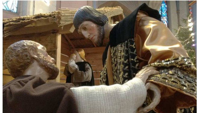
Einer der drei Sterndeuter aus dem Morgenland wendet sich Josef zu, während Maria ihren neugeborenen Sohn liebkost. Krippe Marienkirche 2019