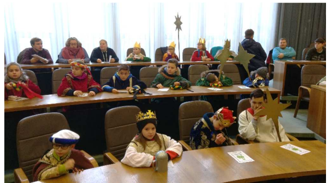
Sternsinger im Ratssaal des Oberhausener Rathauses beim Empfang des Oberbürgermeisters Daniel Schranz