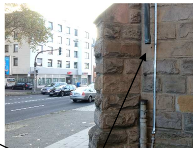
Abgerissene Regenfallrohre an der Mülheimer Straße